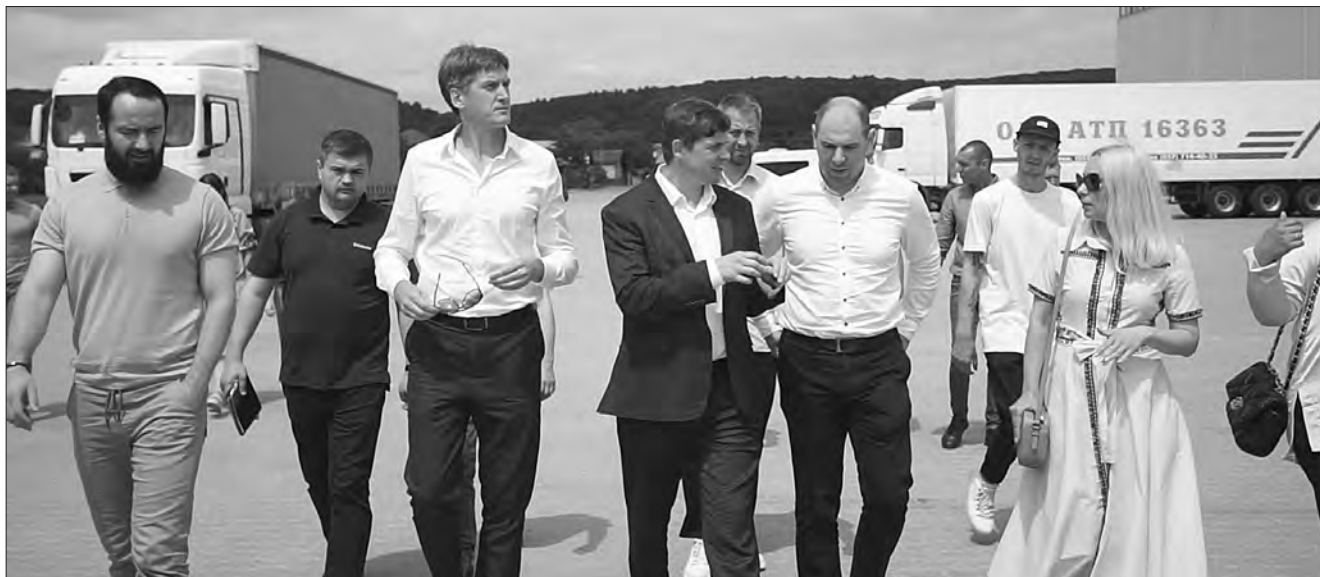
У Калушському індустріальному парку.