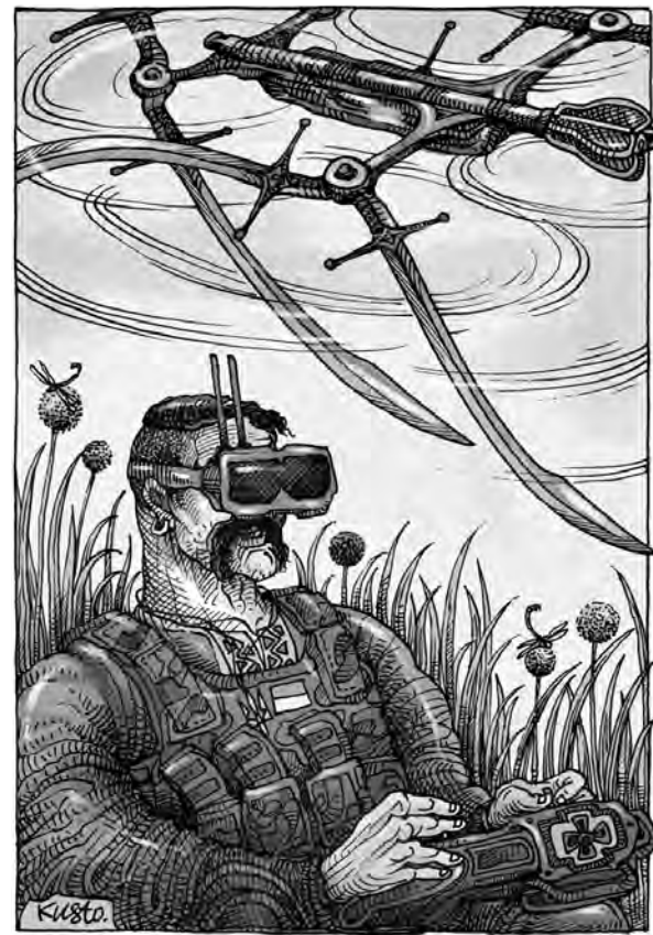
У нові часи нові й козаки.